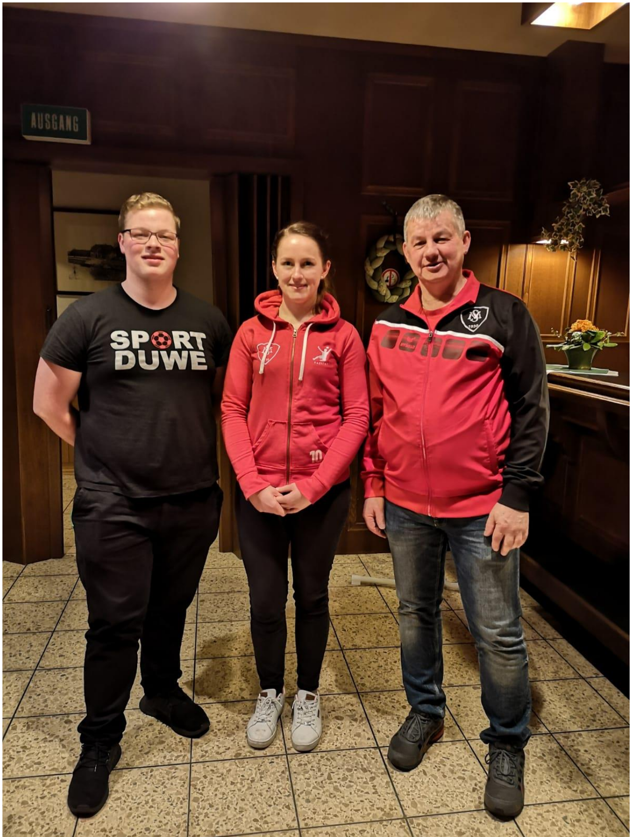
Vorstandssitzung im Brückenhaus Süd Moslesfehn mit einer tollen Beteiligung