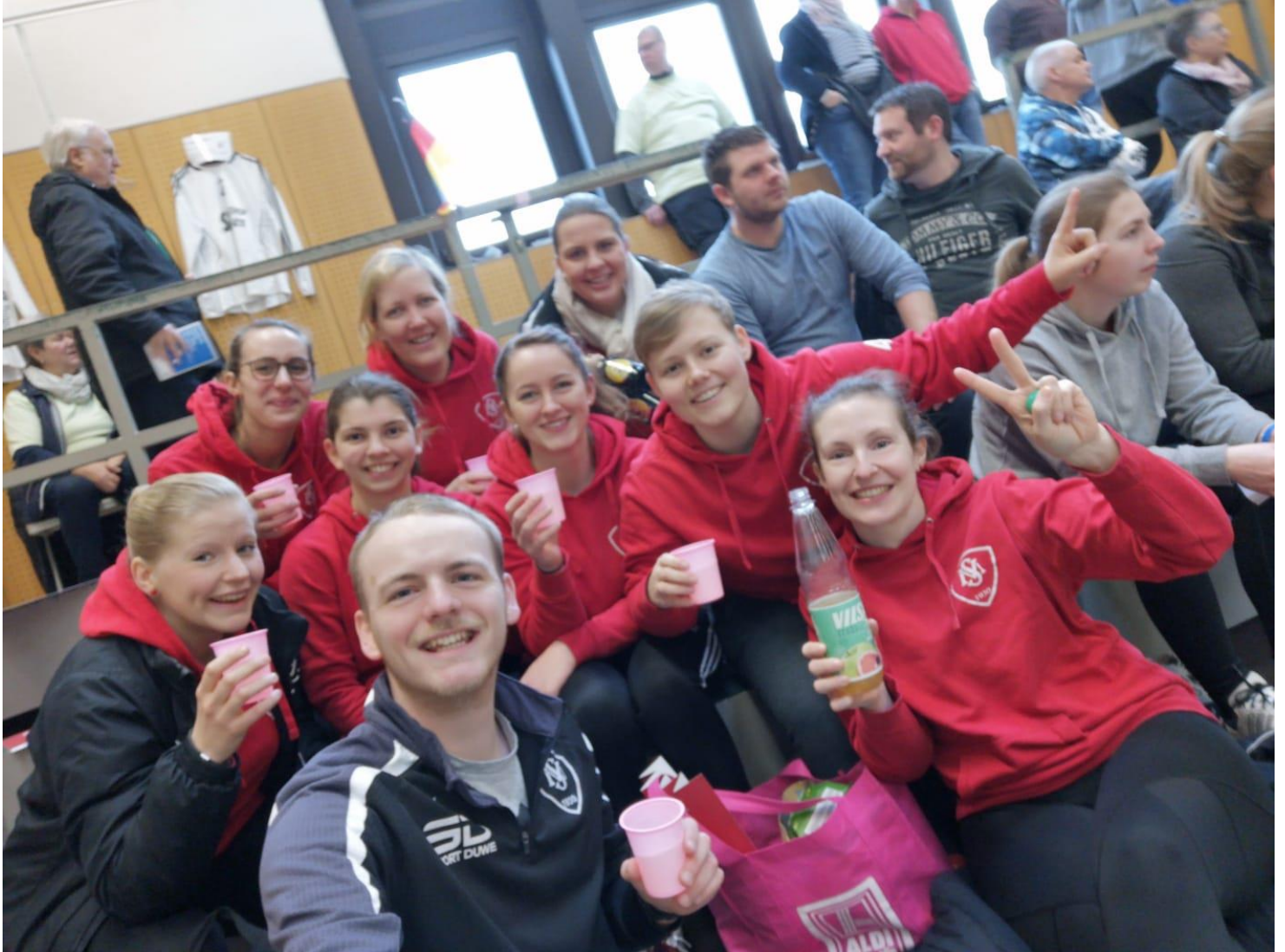
1.Mannschaft - SV Moslesfehn - 2.Bundesliga Nord - Saison 2019/20