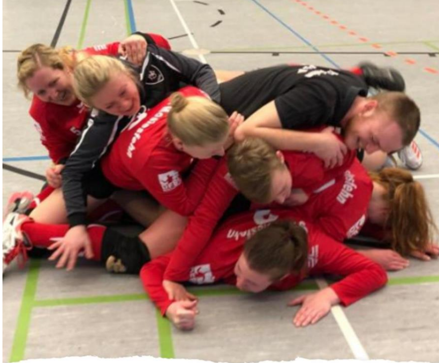
DM Qualifikation + Bilder der Deutschen Meisterschaft in Schneverdingen