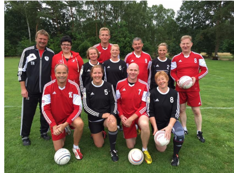
Die Frauen 30 und die Männer 45 vom SV Moslesfehn. Die Männer 45 und die Männer 55 (nicht auf dem Bild) sind schon qualifiziert für die DM in Bardowick