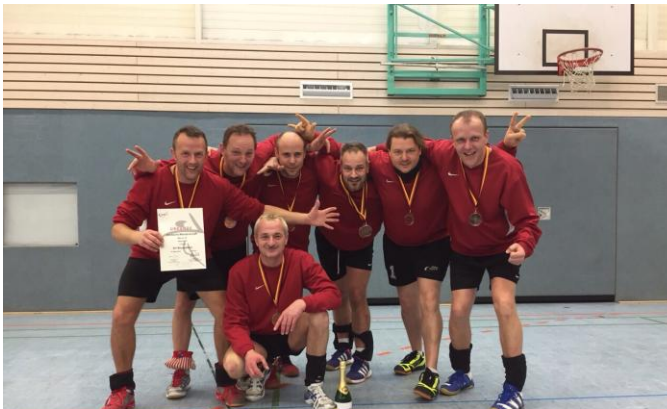
Männer 35 des SV Moslesfehn